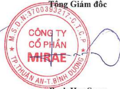
Park Hee Sung